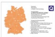
➤ Baden-Württemberg: Pforzheim