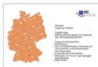
➤ Bayern: Augsburg