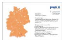
➤ Bayern: München