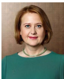
Lisa Paus MdB, Bundesministerin für Familie, Senioren, Frauen und Jugend

” Unternehmen, die Frauen und Männern gute Angebote zur Vereinbarkeit von Beruf und Familie machen, profitieren stark im Ringen um Fachkräfte. Und sie nutzen das Fachkräftepotenzial, das in der Erwerbsbeteiligung von Frauen steckt. Das Unternehmensnetzwerk macht gerade mittelständischen Betrieben zahlreiche Angebote, bietet Ideen und Praxisbeispiele sowie vielfältige Möglichkeiten, betriebliche Erfahrungen auszutauschen. Deshalb lade ich Sie ein: Werden auch Sie Mitglied in unserem Unternehmensnetzwerk „Erfolgsfaktor Familie“..