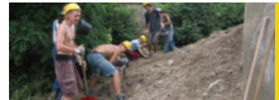
Statt Zivildienst möglich: FSJ in der Denkmalpflege