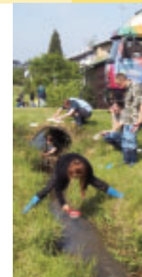
Erfassen, registrieren, kartieren: FÖJ-lerinnen bei der Untersuchung eines Bachlaufs auf Kleinlebewesen.