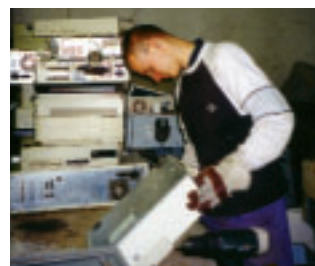
Elektronikschrott enthält wertvolle Reststoffe. FÖJ-ler in Berlin beim Recyclen.