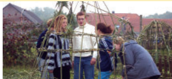
Ein Indianerzelt aus Weidenstöcken. Beim FÖJ-Workshop wird der Umgang mit natürlichen Materialien geprobt.