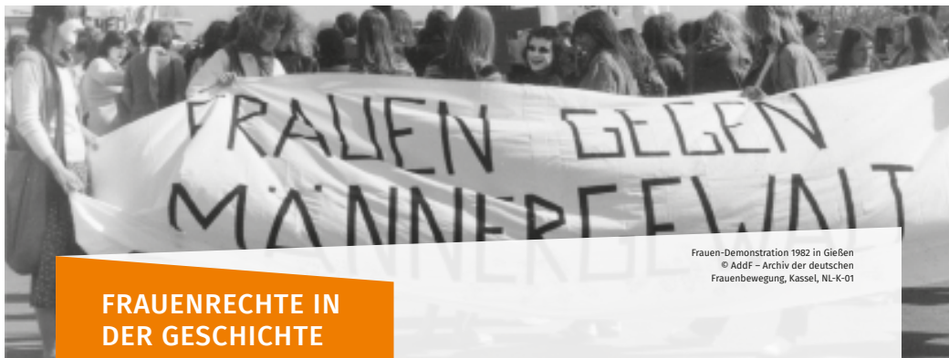
Frauen-Demonstration 1982 in Gießen