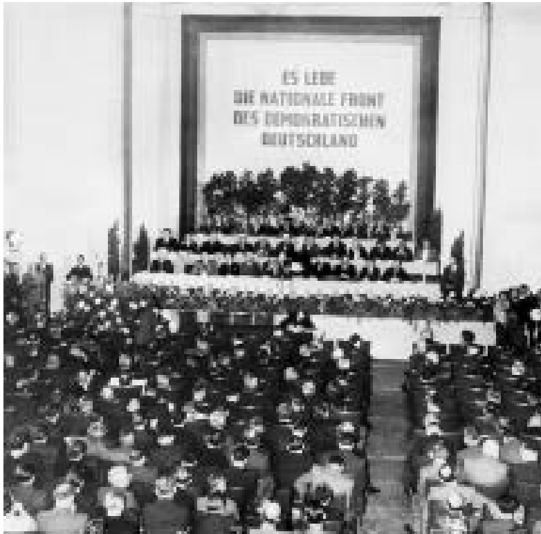
Sitzung des Nationalrates zur Gründung der Deutschen Demokratischen Republik am 7. Oktober 1949

Am 19. März 1949 nahm der Volksrat die ausgearbeitete Vorlage als „Verfassung der Deutschen Demokratischen Republik“ an. Die sowjetische Besatzungsmacht zögerte allerdings die Konstituierung der DDR noch bis zum 7. Oktober 1949 hinaus, um die Wahlen zum Bundestag im August 1949 und die Konstituierung der Bundesregierung im September 1949 abzuwarten. Die Verfassung der DDR formulierte ihren Geltungsanspruch als „gesamtdeutsch“, daher gibt es im Text keinerlei Hinweise auf die Gültigkeit als Provisorium bis zur Wiederherstellung der staatlichen Einheit Deutschlands.