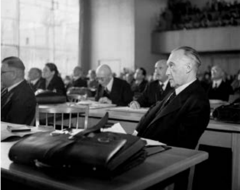
Der spätere Bundeskanzler Konrad Adenauer (CDU) leitete als Präsident die Beratungen des Parlamentarischen Rates