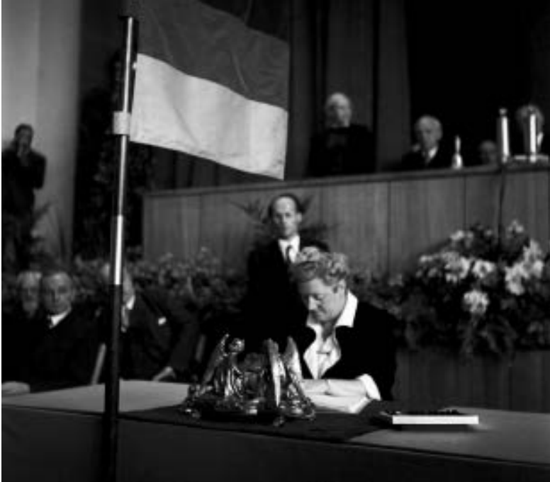
23. Mai 1949 – Elisabeth Selbert unterzeichnet das Grundgesetz