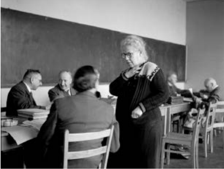
Helene Weber im Gespräch mit Fraktionskollegen des Parlamentarischen Rates