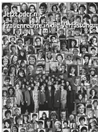
Plakat der Kampagne „Jetzt oder nie. Frauenrechte in die Verfassung“; Quelle: FFBIZ e.V.

© Landesarbeitsgemeinschaft der bezirklichen Gleichstellungs- und Frauenbeauftragten Berlin